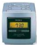
le radio-réveil clock radio