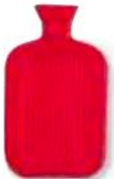
la bouillotte hot-water bottle