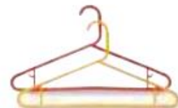
le cintre coathanger