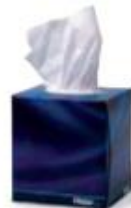
la boîte de kleenex box of tissues