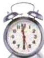
le réveil alarm clock