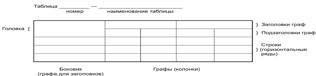
Рисунок 1 – Оформление таблиц

При делении таблицы на части допускается ее головку или боковик заменять соответственно номерами граф и строк. При этом нумеруют арабскими цифрами графы и (или) строки первой части таблицы. Таблица оформляется в соответствии с рисунком 1.