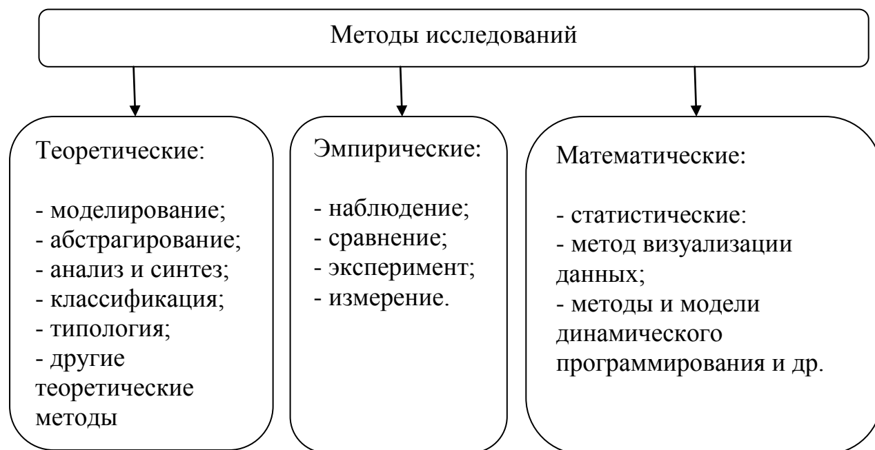
Рис. 2. Методы научного исследования.

Просто не следует использовать слова и выражения, которые не имеют смысловой нагрузки, а также повторы, слова-паразиты, излишнюю конкретизацию.