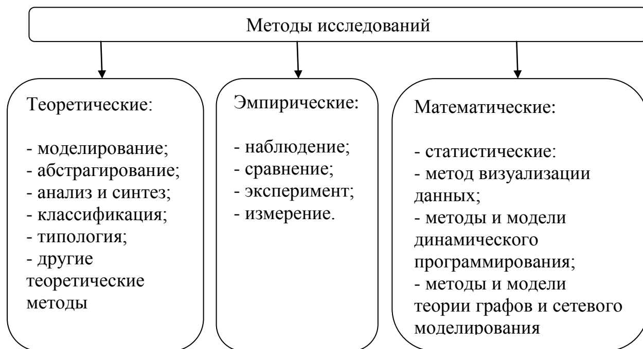
Рис. 2. Методы научного исследования.

В раздел « Приложения » включается вспомогательный материал. Каждое приложение должно начинаться с нового листа с указанием вверху листа выравниванием по правому краю слова «Приложение», нумероваться заглавными буквами А, Б, В, Г и т.д. и иметь тематический заголовок.