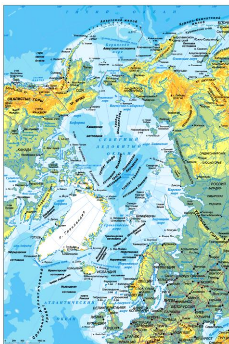
Рис. 1 – Современная физическая карта Арктики