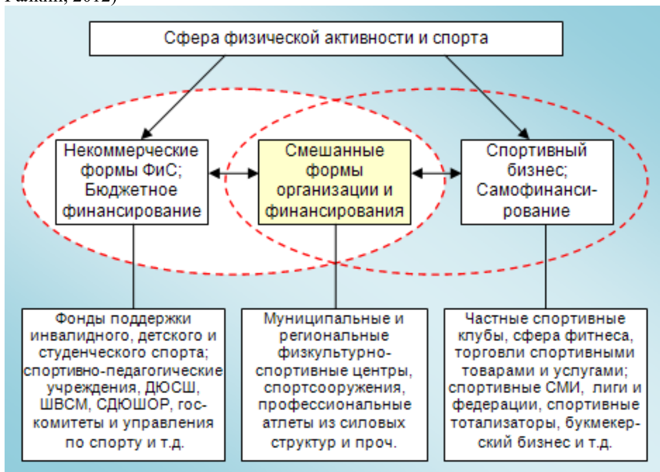
Рис.5 - Структура и состав физкультурно-спортивной отрасли, подразделенной по принципу финансирования [10]

В. В. Галкин в своей статье «Спортивный бизнес в системе экономических отношений» приводит следующую структуру физкультурно-спортивной отрасли, подразделенной по принципу финансирования (рис.5 - источник: «Спортивный бизнес в системе экономических отношений»/В. В. Галкин, 2012)