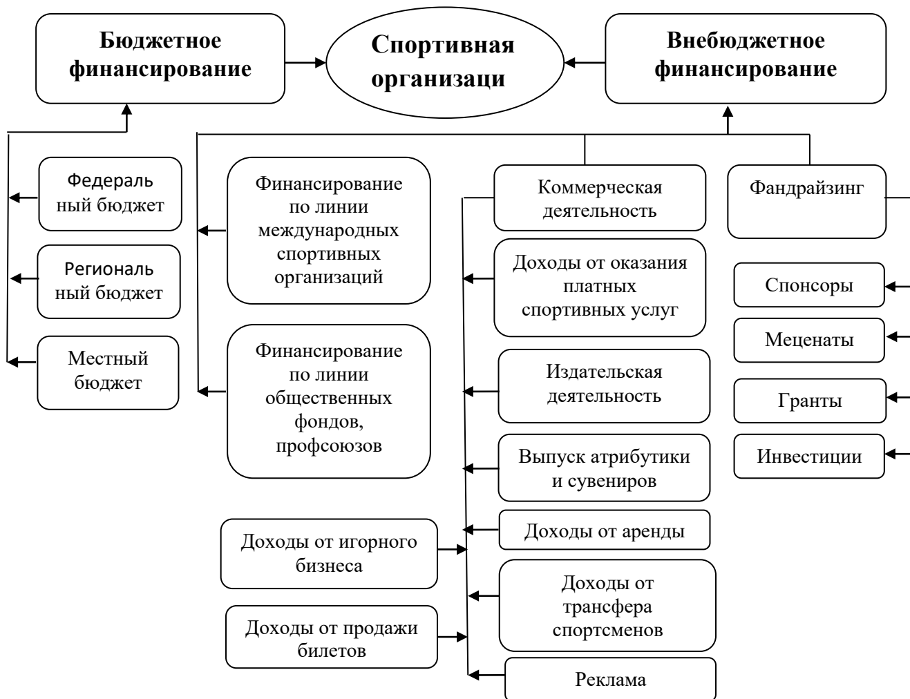
Рис.8 - Структура источников финансирования спортивных клубов и организаций в Российской Федерации [14]

Очевидно, что все отмеченные группы источников финансирования значительно различаются по своей экономической природе, а также формам и способам получения денежных средств. Более того, даже внутри одной группы инструменты финансирования могут весьма существенно дифференцироваться.