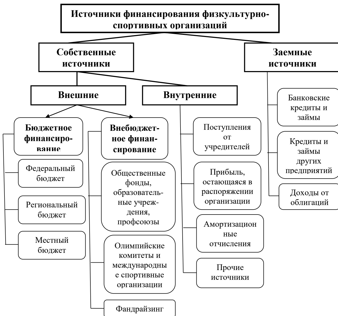
Рис.7- Классификация источников финансирования физкультурно-спортивных организаций [11]

Источники финансирования физической культуры и спорта можно разделить на собственные и заемные (рис.9 - Источник: Построено на основании учебника для студентов вузов, обучающихся по экономическим специальностям, специальности 080105 Финансы организаций (предприятий) «Финансы и кредит» / [Н.В. Колчина и др.); под ред. Н.В. Колчиной. — 4-е изд., перераб. и доп. — М.: ЮНИТИ-ДАНА, 2007. - 383 с)