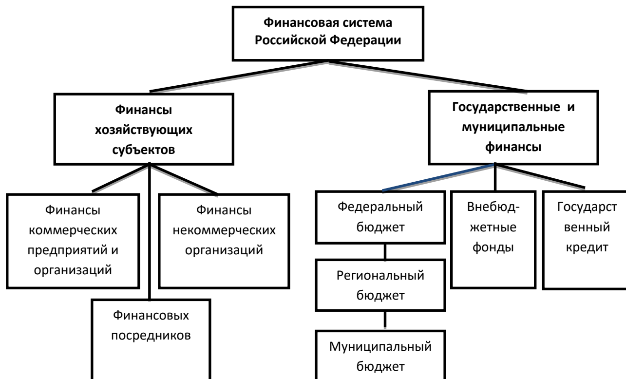
Рис.4 - Финансовая система РФ [12]

Финансовая система Российской Федерации в целом состоит из двух укрупненных подсистем: государственных и муниципальных финансов и финансов хозяйствующих субъектов. В зависимости от конкретных форм и методов формирования доходов и денежных фондов они в свою очередь делятся на звенья (рис. 5 - Источник: Построено на основании учебного пособия «Финансы»/ Ковалева А.М., 2-изд., - М.: Финансы и статистика, 2011.).