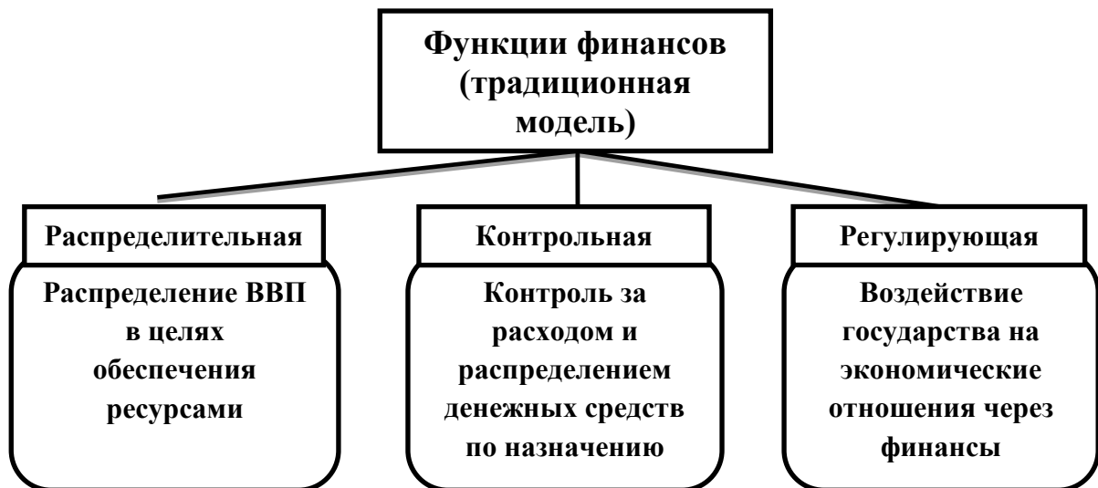
Рис.1-Функции финансов (традиционная модель)[13]

Распределительная функция (рис.2 - источник: практикум для практической работы по дисциплине «Финансы предприятия» для студентов экономических специальностей»/И. Д. Кузнецова, Е. А. Обрабова ГОУ ВПО Иван.гос.хим.-технол.универ-т - Иваново, 2008 – 72с.).