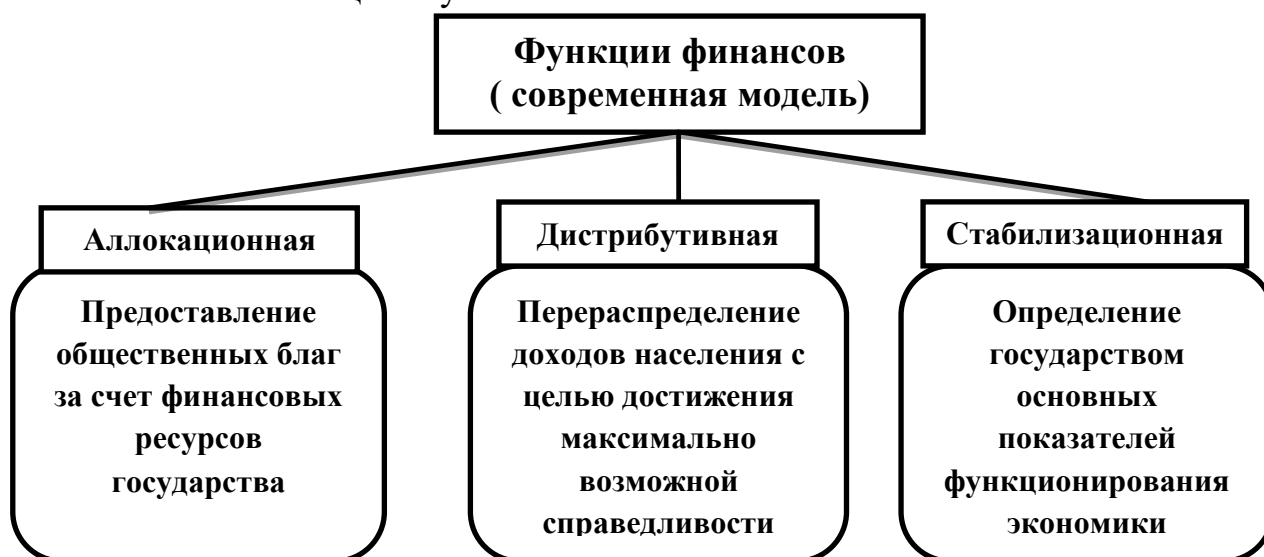
Рис.3 - Функции финансов (современная модель) [13]