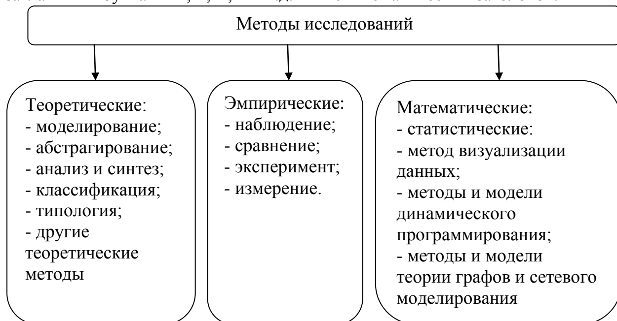
Рис. 2. Методы научного исследования.

В раздел « Приложения » включается вспомогательный материал. Каждое приложение должно начинаться с нового листа с указанием вверху листа выравниванием по правому краю слова «Приложение», нумероваться заглавными буквами А, Б, В, Г и т.д. и иметь тематический заголовок.